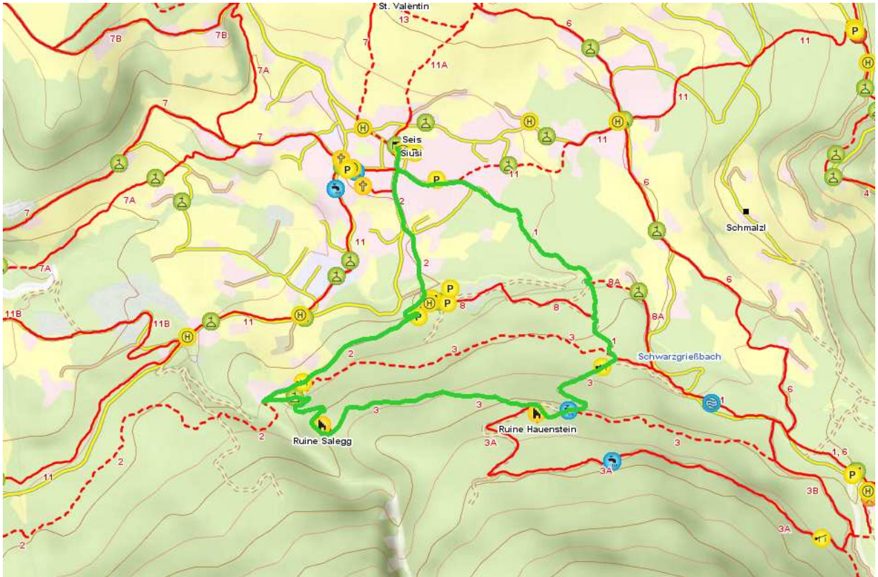
Karte © 2007 TuGA - Lana

© 2007 Autonome Provinz Bozen - Südtirol