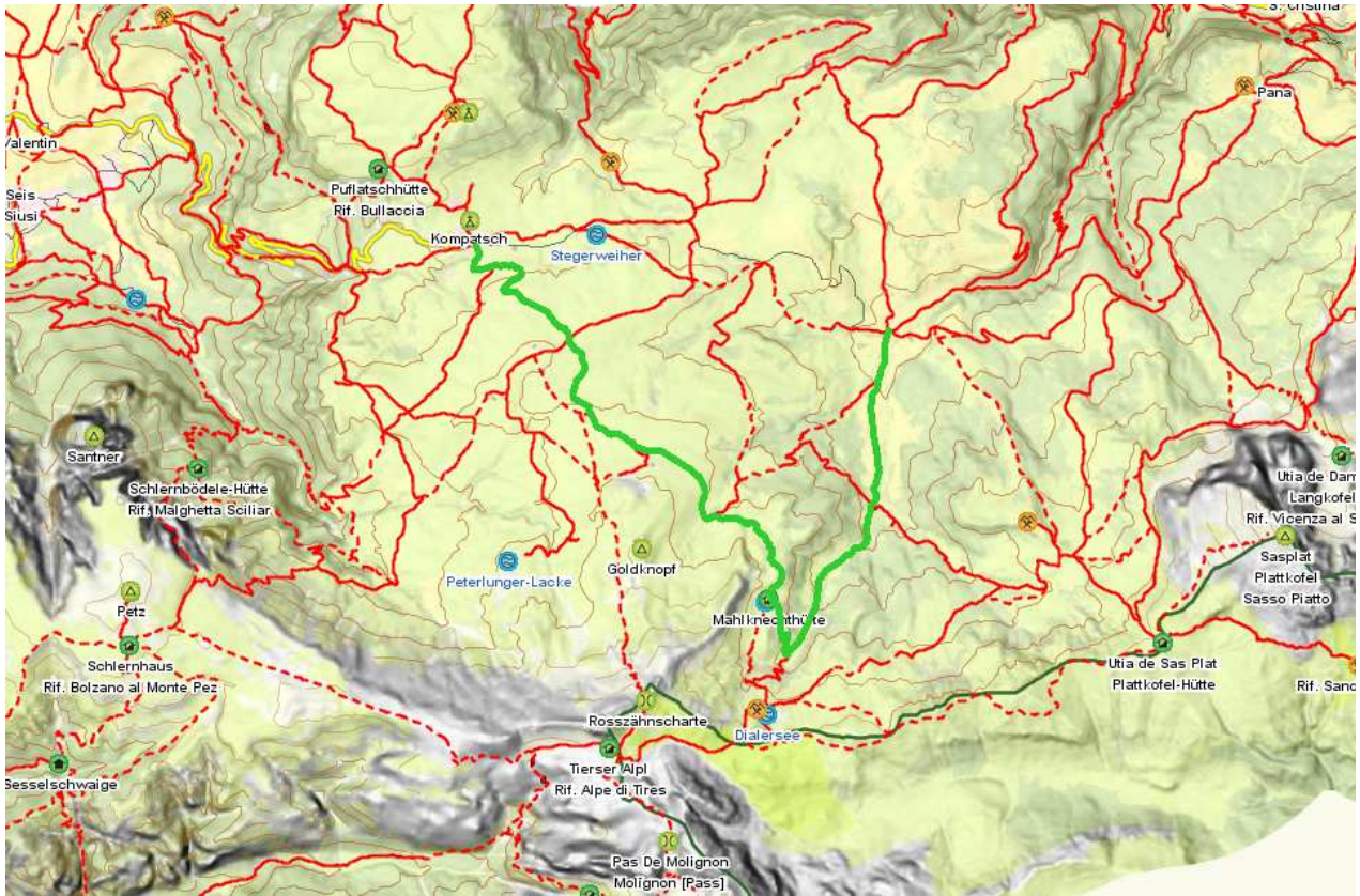
Karte © 2007 TuGA - Lana

© 2007 Autonome Provinz Bozen - Südtirol